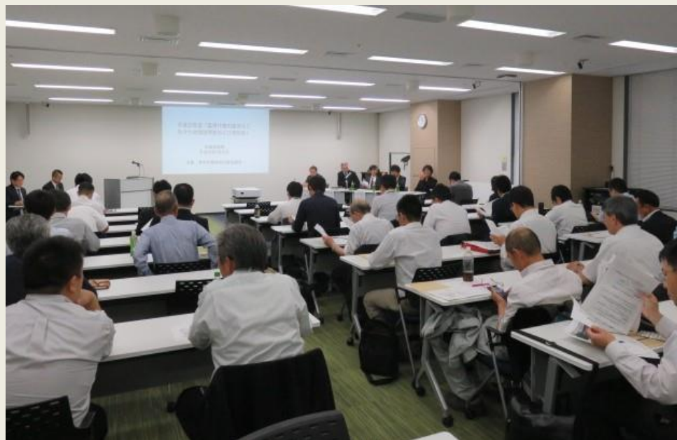
◆第1部 説明会の様子

札幌会場には、行政関係者および生産者など32名が参加し、説明会と個別相談の2部構成で実施された。今年度は、従来から要望されていた「産地化取組事例の報告」や「技術アドバイザー派遣」に関して、日本漢方生薬製剤協会から初めて報告が行われた。