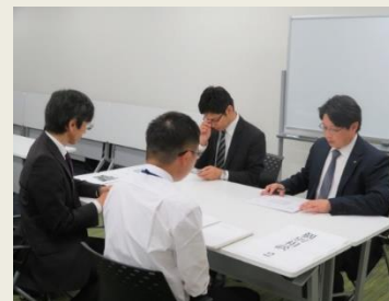
◆第2部 個別相談会の様子