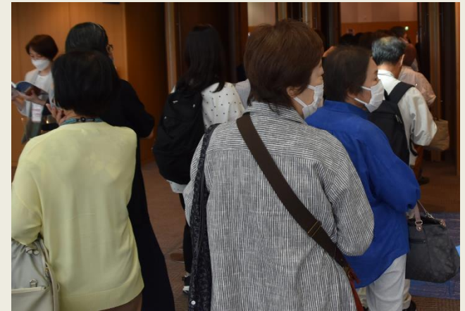
【開催前の聴講希望者の列】