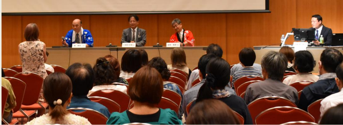
【ディスカッション形式での質疑応答】

講演終了後は、演者が壇上に上がり、質問を受けるディスカッションの場が設けられた。質問は、会場、Webともに時間内におさまらないほど、数多く挙がり、活発な質疑応答が繰り広げられた。