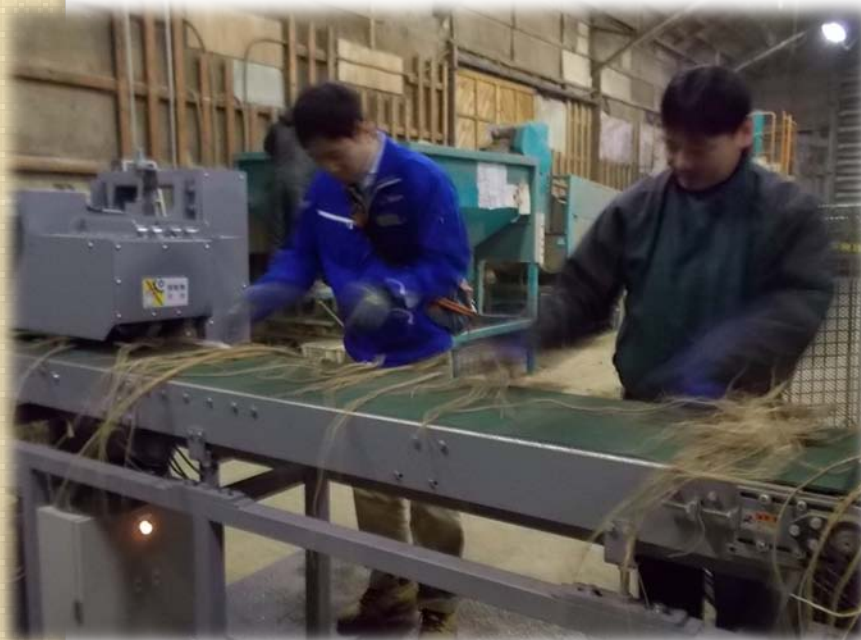
切断機側から見た状況