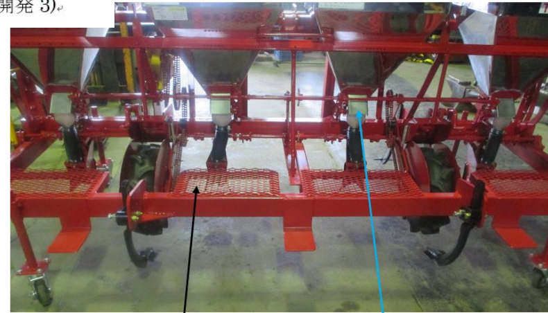
肥料投入時用足場