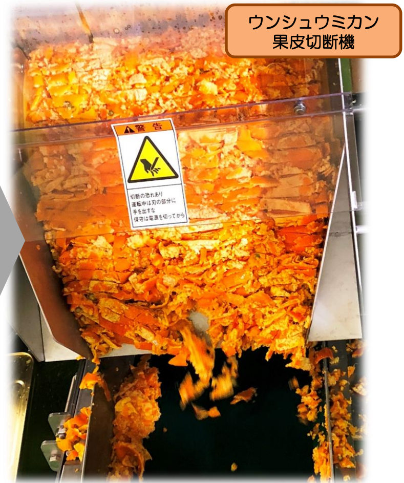
ウンシュウミカン 果皮切断機