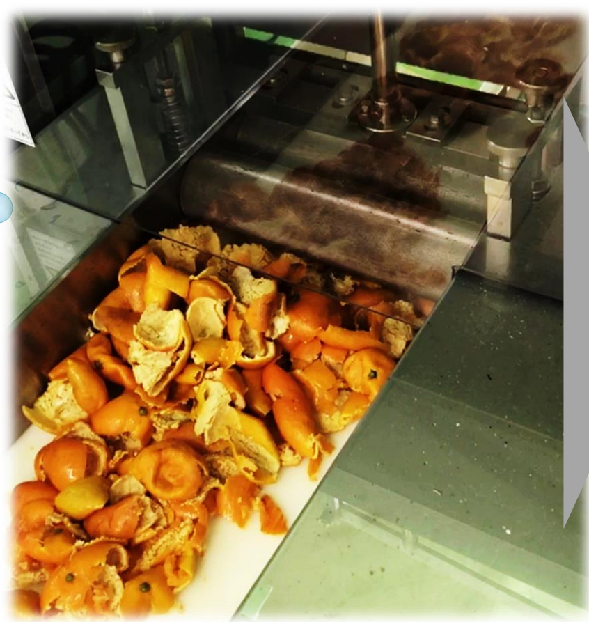
ウンシュウミカン 果皮切断機