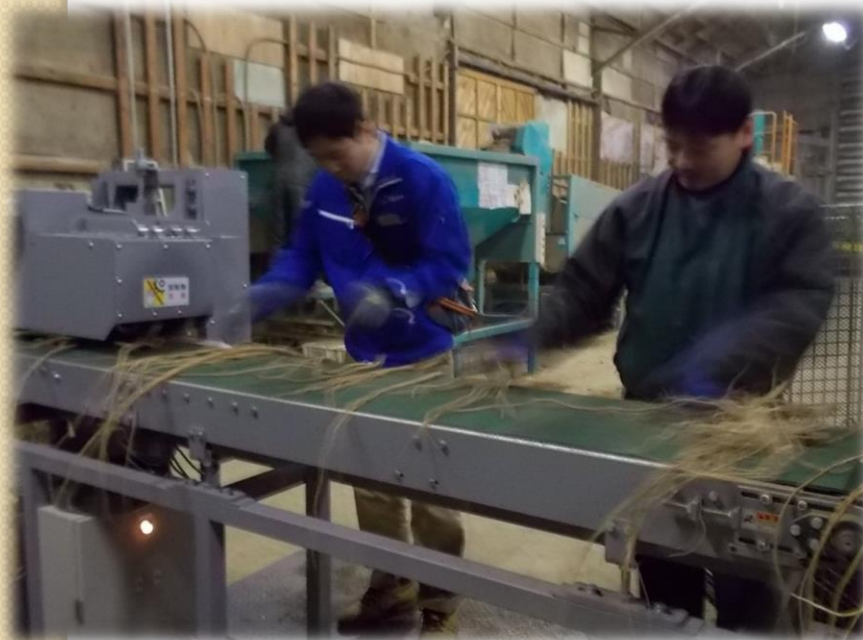
切断機側から見た状況